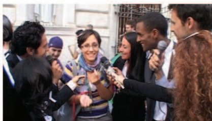
Vodafone 'one cent'