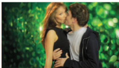
Heineken 'beer gloss'